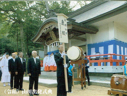
(令和) 山川出発式典