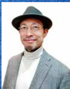
北方 喜旺丈 (作曲家・ピアニスト)