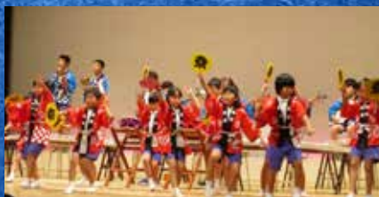
知恵島小学校 演奏発表 (和楽器合奏と阿波踊り)