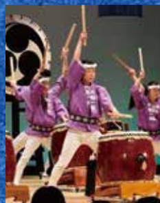
NPO 法人 太鼓の楽校