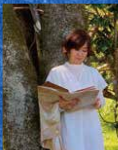
北方 邁羽 (言霊家)